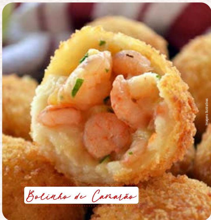
Bolinho de Camarão