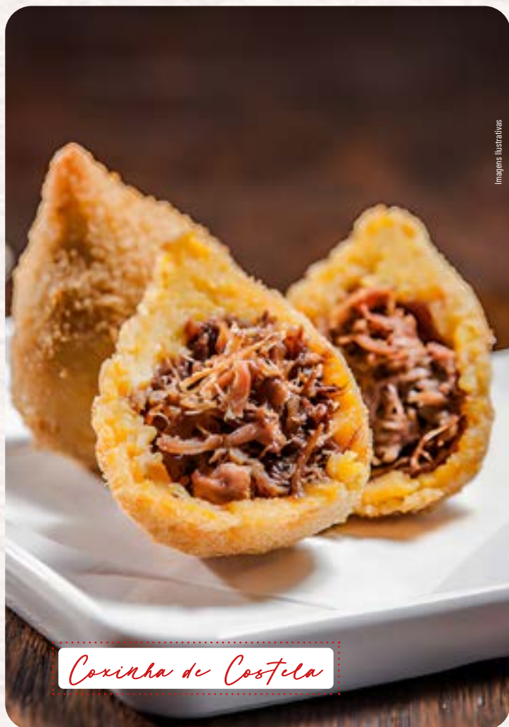
Coxinha de Costela

Linguiça toscana artesanal, temperado com páprica defumada, mostarda, salsinha, recheado com Catupiry e empanado na Panko. 6 unidades