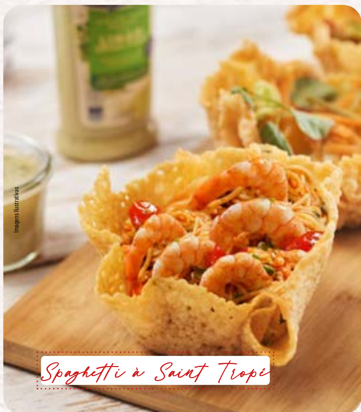
Spaghetti à Saint Trope

Servido na crosta de parmesão com camarões graudos, creme de leite, Catupiry, tomate, salsinha e cebolinha.