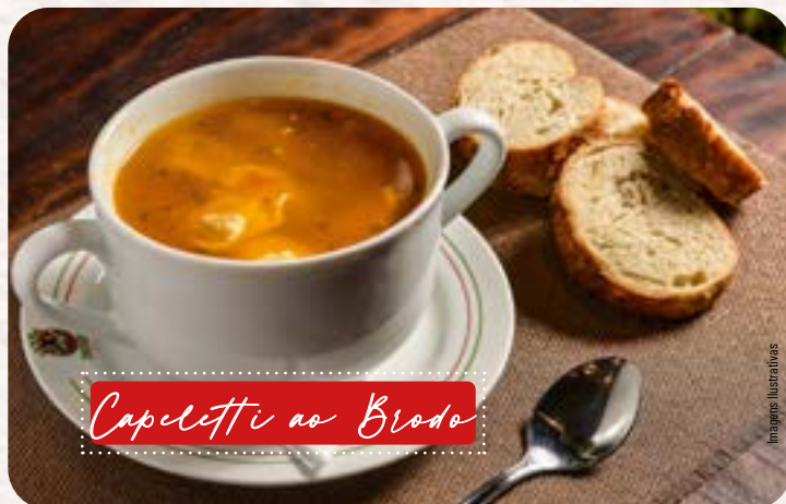
Capeletti ao Brodo

Capeletti de carne, ao molho brodo, com frango desfiado, salsinha, cebolinha e acompanhamento com cesto de pães.