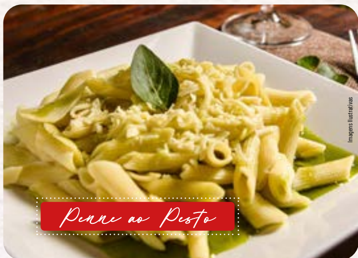
Penne ao Pesto